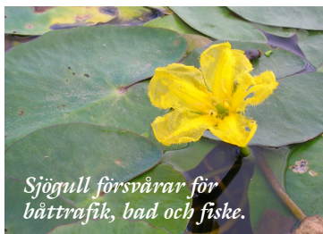
Sjögull försvårar för båttrafik, bad och fiske.

Sjögull har flytande blad och gula blommor som påminner om näckrosor. Den har sitt ursprung i Centraleuropa och Asien och planterades in i sjön Väringen i Örebro län på 30-talet för att sedan därifrån sprida sig genom Arbogaån vidare ut i Mälaren.